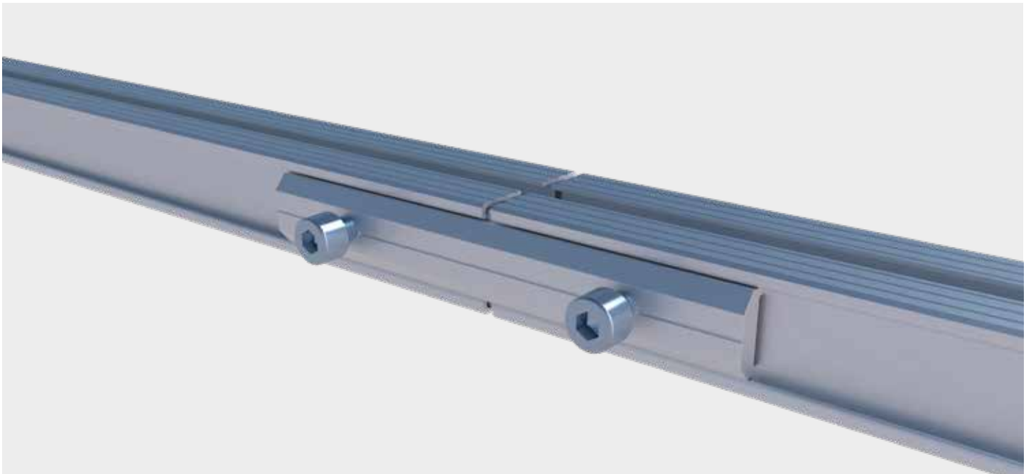
Verbindung zweier Montageprofile mittels Profilverbinder