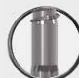
7 mm gewindefreier Teil hinter der Bohrspitze