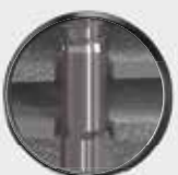
Gewindefreier Teil dreht in Bauteil 1 durch.