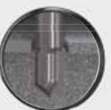
Bohrspitze bohrt sich währenddessen durch Bauteil 2.